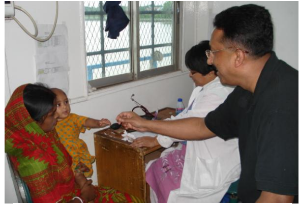
Landen vertegenwoordiger Terre des Hommes Bangladesh

in Bangladesh: "Tien jaar geleden, toen we begonnen met de Shapla, wisten we al dat de Shapla alleen niet de uiteindelijke oplossing was voor de gezondheidsproblemen van de bevolking. Daarom hebben we ook altijd veel aandacht besteed aan preventieve gezondheidszorg. We willen namelijk dat de gezondheid van mensen zodanig goed is dat ze niet naar de Shapla hoeven komen voor een behandeling. Als we goed op onze gezondheid en persoonlijke hygiëne letten, worden we minder snel ziek en hebben we de Shapla niet meer nodig. In de afgelopen tien jaar is het aantal patiënten gedaald vanwege onze inzet op preventieve gezondheidszorg. Bijna alle kinderen zijn ingeënt, steeds minder kinderen zijn ondervoed en het aantal kinderen dat overlijdt in de eerste jaren van hun leven, is verminderd. In de afgelopen tien jaar is het ons dus gelukt om de