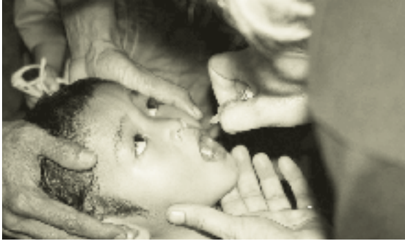
Vaccinaties voor kinderen.

De SHO-gelden werden verdeeld over achttien Nederlandse hulporganisaties om de slachtoffers van de tsunami bij te staan.