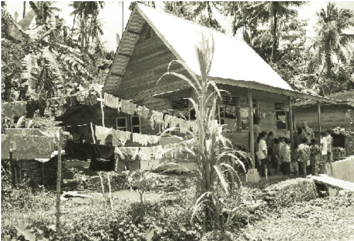
Eén van de vele nieuw gebouwde huizen.

In Sri Lanka vonden 35.000 mensen de dood en raakten ruim een half miljoen burgers ontheemd. De SHO-bijdrage aan Sri Lanka bedroeg ruim € 67 miljoen. Door de grote inzet van de lokale bevolking en hulpverleners konden de eerste vissers binnen enkele weken na de ramp de zee weer op. Behalve een positieve uitwerking op het levensonderhoud en voedselvoorziening van families zorgde dit er ook voor dat mensen hun leven weer op konden pakken en hun trauma konden verwerken. Tijdens de wederopbouw is het meeste geld besteed aan huisvesting. Het conflict tussen de Tamil Tjigers en het leger is van negatieve invloed op de hulp geweest. Ook is er onzekerheid over de duurzaamheid van de tsunami-programma's, als gevolg van de vijandelijkheden.