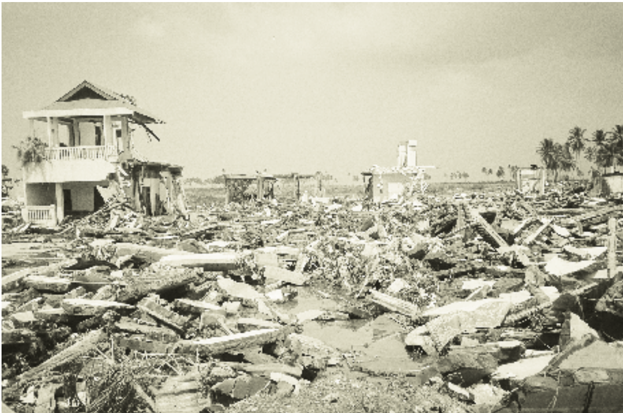
De verwoesting na de tsunami was enorm.

Tijdens de burgeroorlog in Sri Lanka zijn in het verleden door de strijdende partijen landmijnen gelegd. De tsunami heeft dit probleem verergerd. De mijnen zijn losgeraakt door de vloedgolven en lagen verspreid over een veel groter gebied. Er zijn verschillende organisaties bezig geweest om de mijnen op te sporen en te verwijderen. Ook zijn gevaarlijke gebieden gemarkeerd.